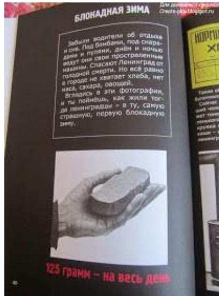
Фото этого кусочка хлеба знают, мне кажется все дети Советской страны... С детства помню это изображение...